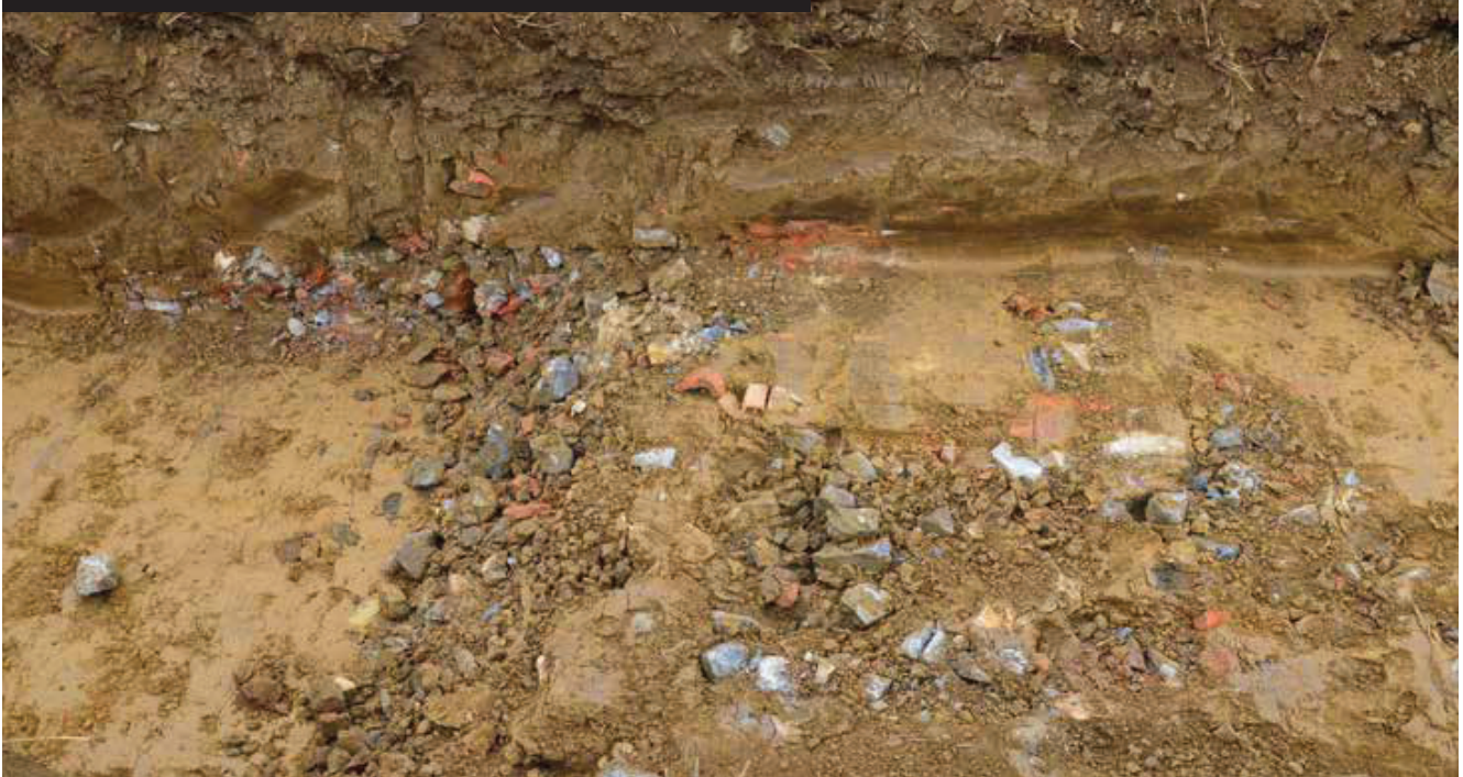
Remblais de démolition sur le bord d'une dépression face au logis