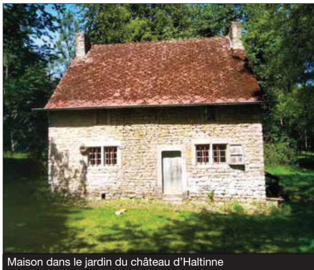
Maison dans le jardin du château d'Haltinne

De plus, l'étude typologique des éléments remarquables tels que les corbeaux ou les pierres taillées ainsi que l'étude des dimensions du bâtiment permettront une datation plus précise