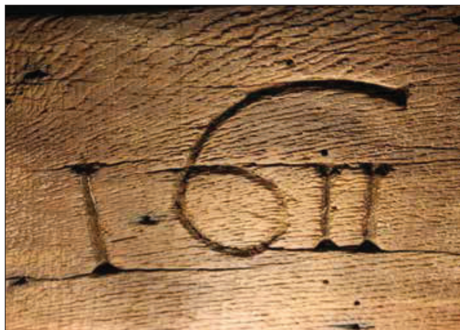
Date gravée dans la poutre de la maison du 21, Froidebise.

angles entre poteaux et sablières. Le hourdis en torchis a laissé place à une date indéterminée à un remplissage en briques.