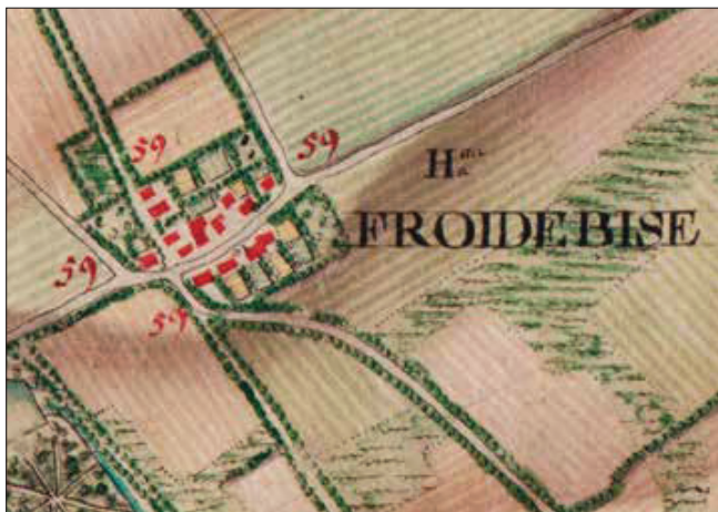
Carte de Ferraris, Froidebise. Détail