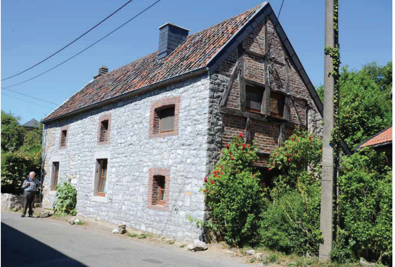
Maison sise 21, Froidebise.