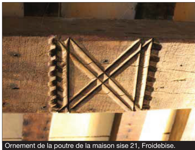
Ornement de la poutre de la maison sise 21, Froidebise.

L'étude de ce pan-de-bois vient compléter les deux premiers bâtiments étudiés en 2019 à Havelange. Nous envi-